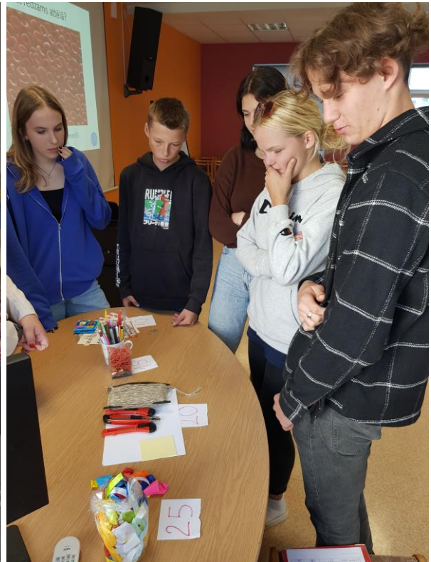
Komandu saliedēšanās aktivitātes