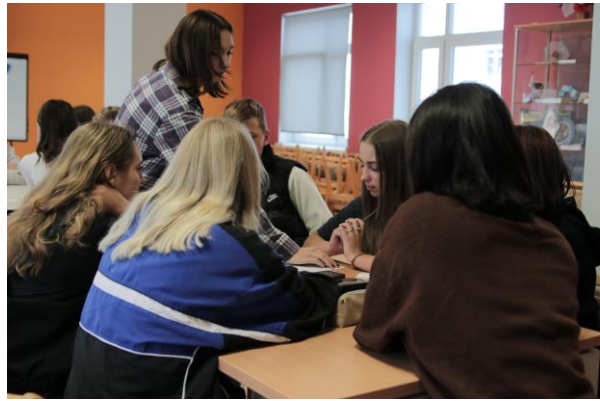
Komandu saliedēšanās aktivitātes