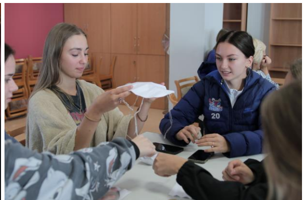
Komandu saliedēšanās aktivitātes